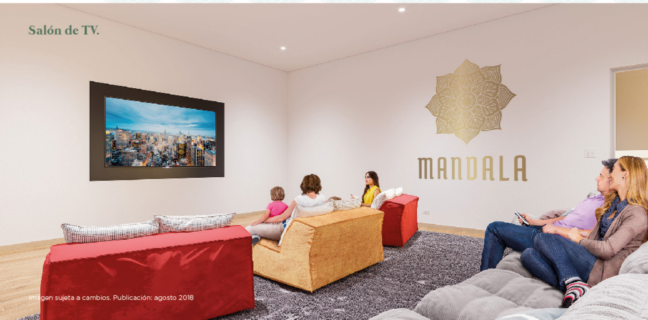
Imagen sujeta a cambios. Publicación: agosto 2018