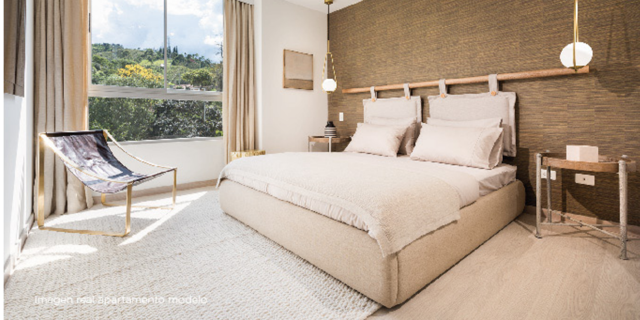
Imagen real apartamento modelo