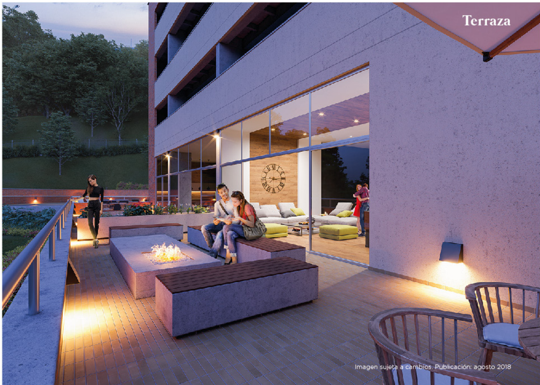
Imagen sujeta a cambios. Publicación: agosto 2018