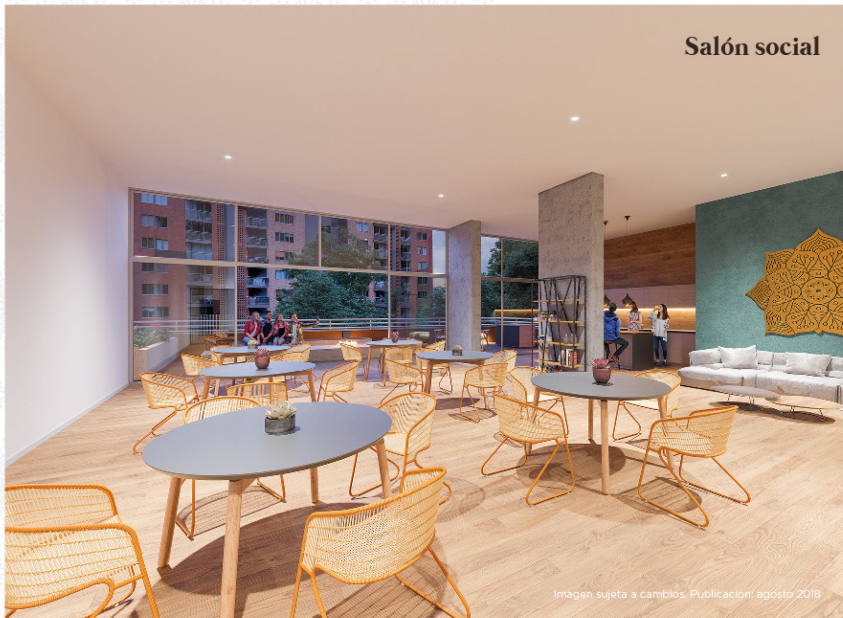
Imagen sujeta a cambios. Publicación: agosto 2018