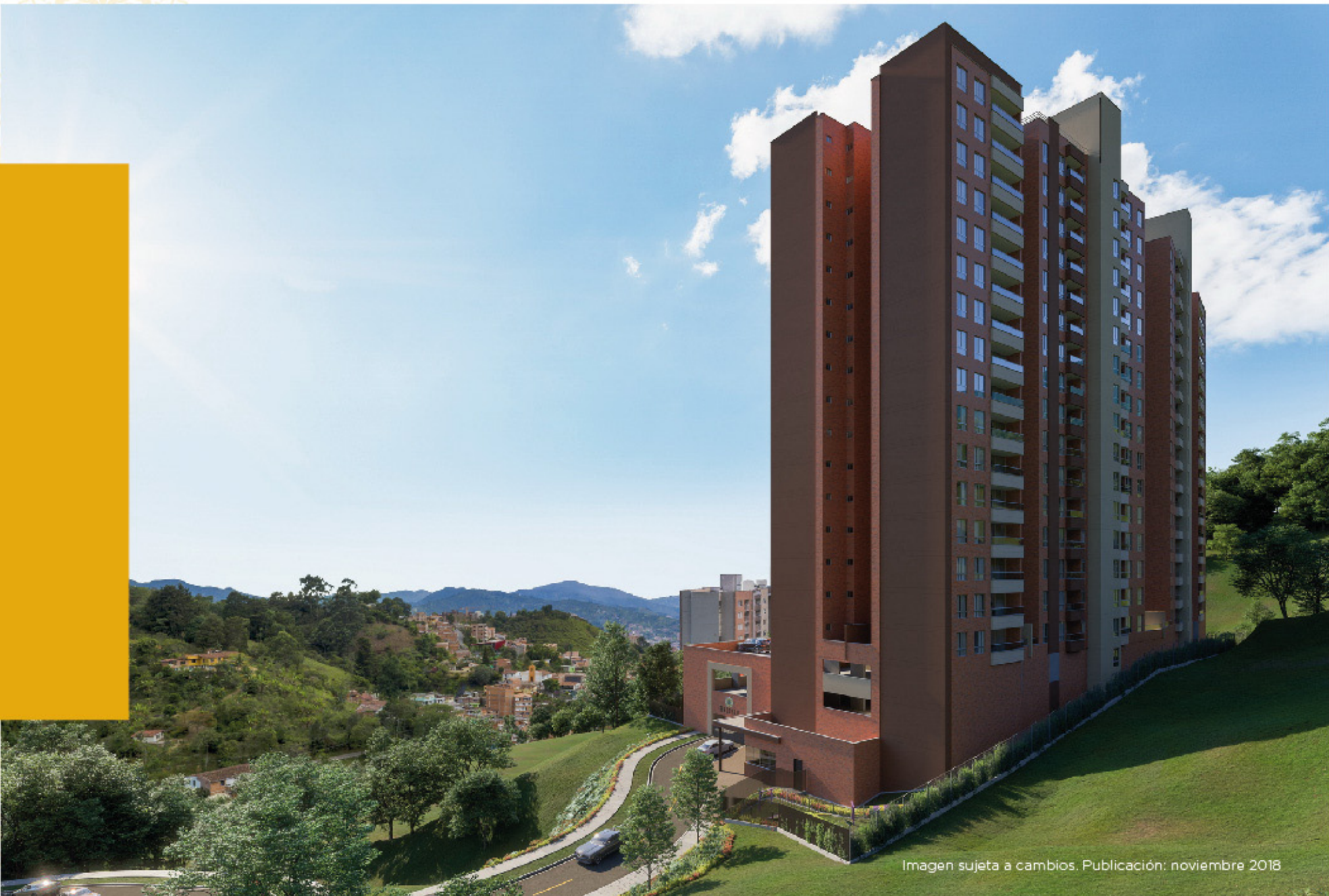
Imagen sujeta a cambios. Publicación: noviembre 2018