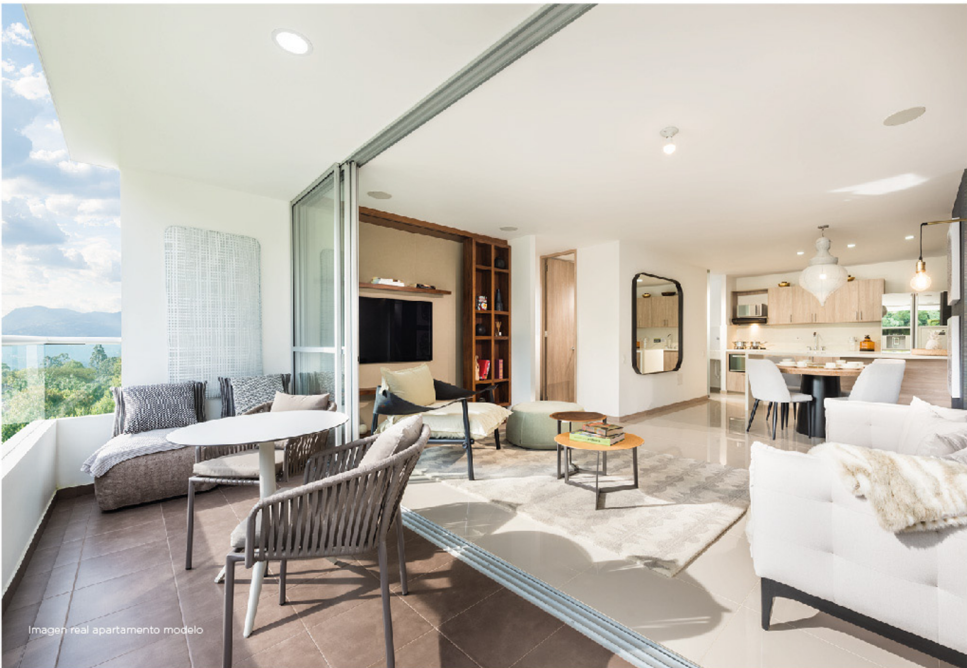
Imagen real apartamento modelo