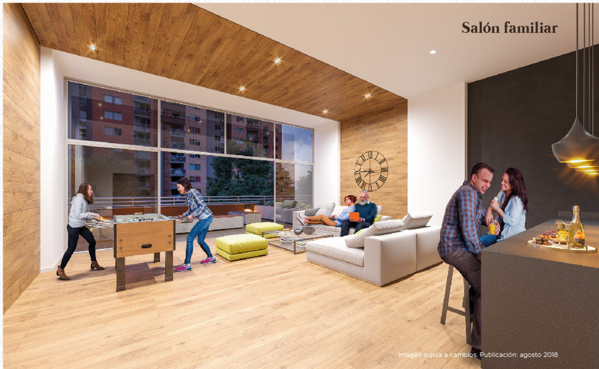
Imagen sujeta a cambios. Publicación: agosto 2018