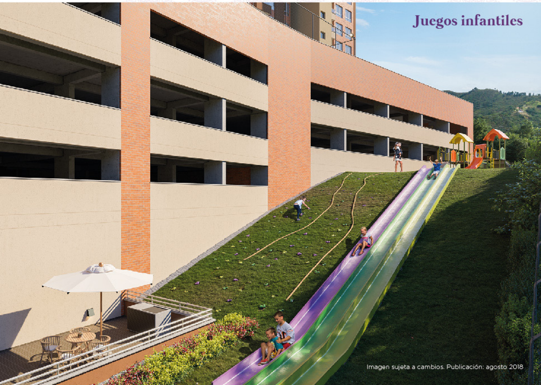
Imagen sujeta a cambios. Publicación: agosto 2018