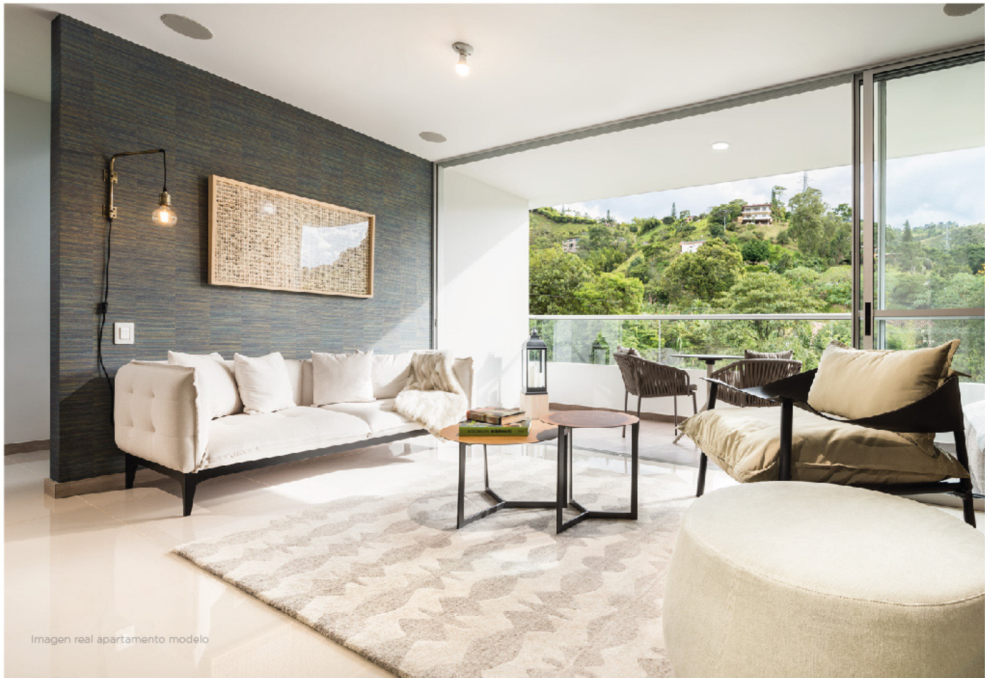
Imagen real apartamento modelo