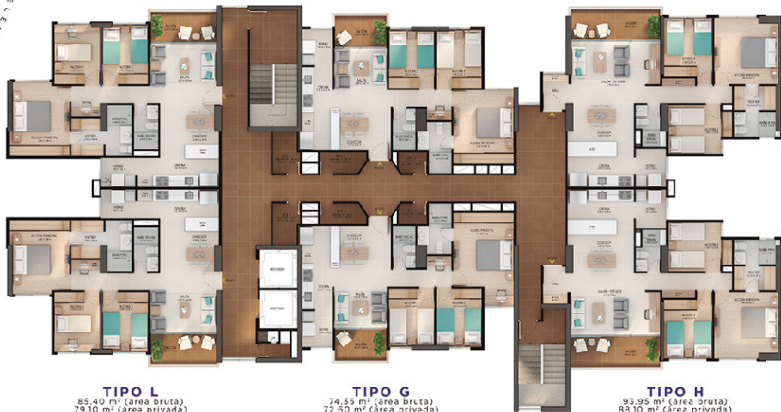
TIPO L 85.40 m 2 (área bruta) 79.10 m 2 (área privada)