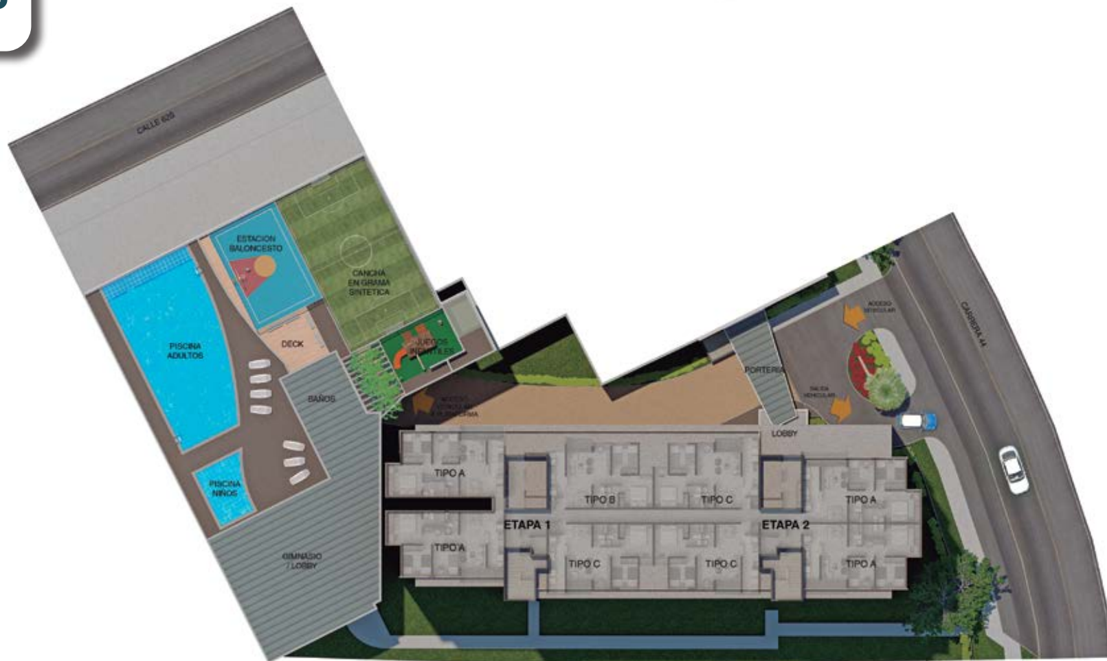
Ilustración sujeta a cambios. Sugerimos corroborar lo datos, antes de suscribir un contrato con la sociedad desarrolladora del proyecto. Fecha de publicación: Diciembre 2015.