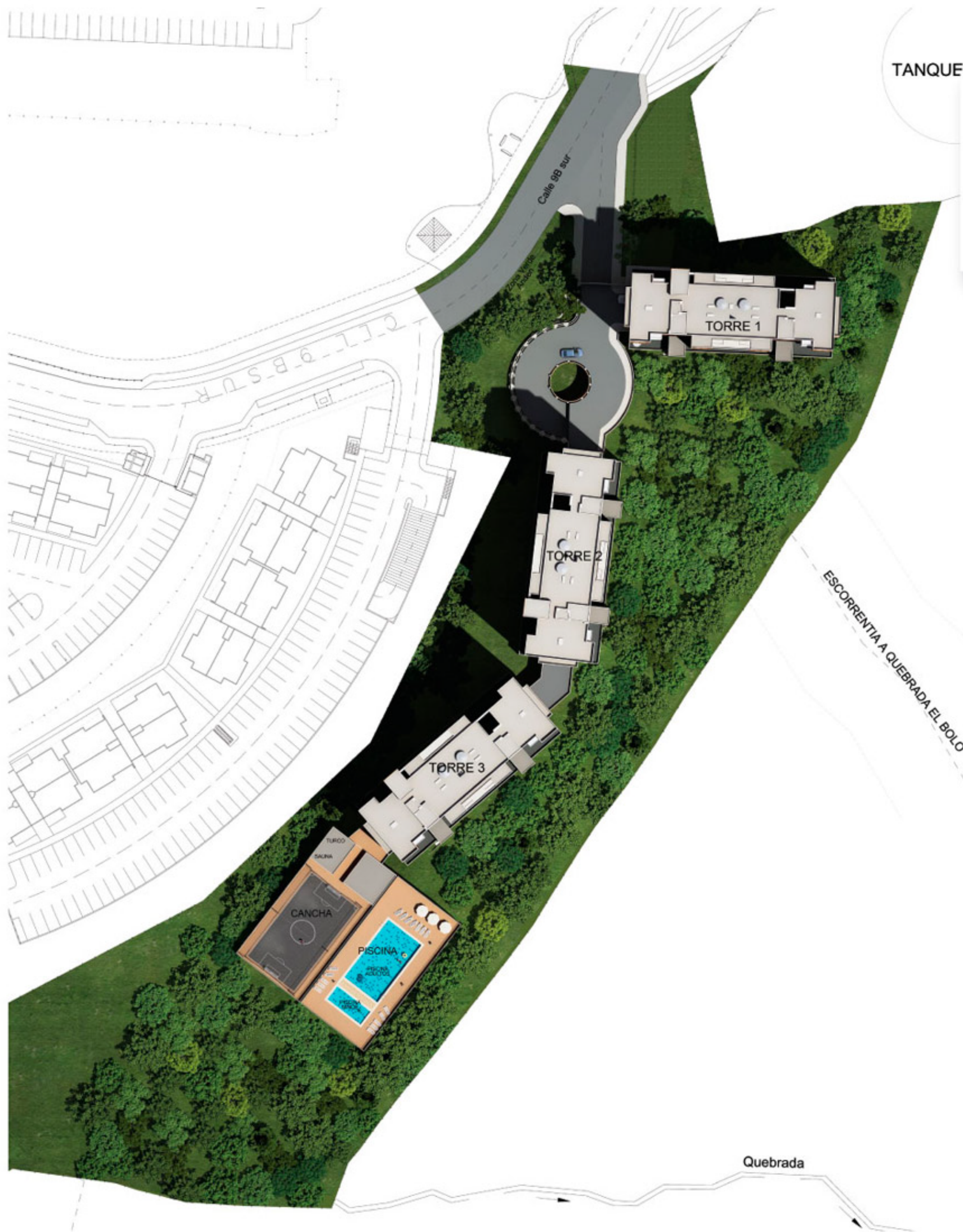
Ilustración sujeta a cambios sin previo aviso. Se sugiere corroborar los datos con la sala de ventas, antes de suscribir un contrato con la sociedad promotora. Fecha de publicación septiembre de 2015.