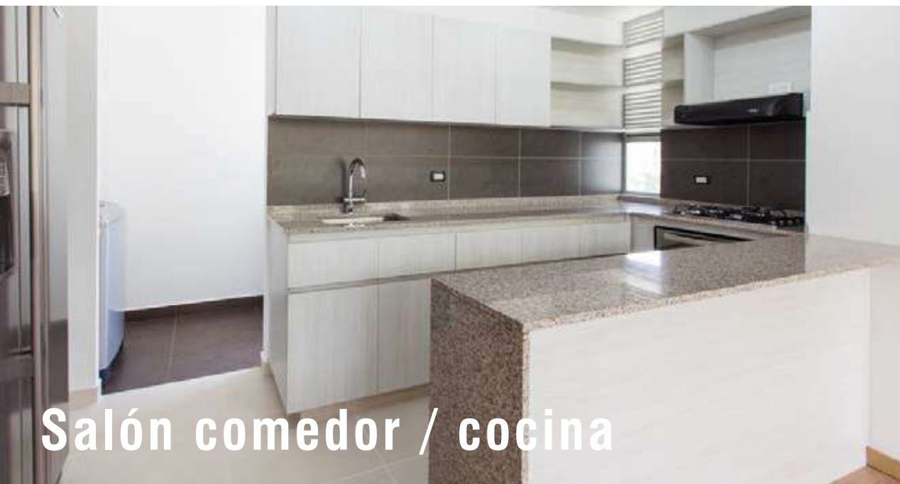
Salón comedor / cocina

Apartamentos de 3 alcobas y 3 alcobas + estudio