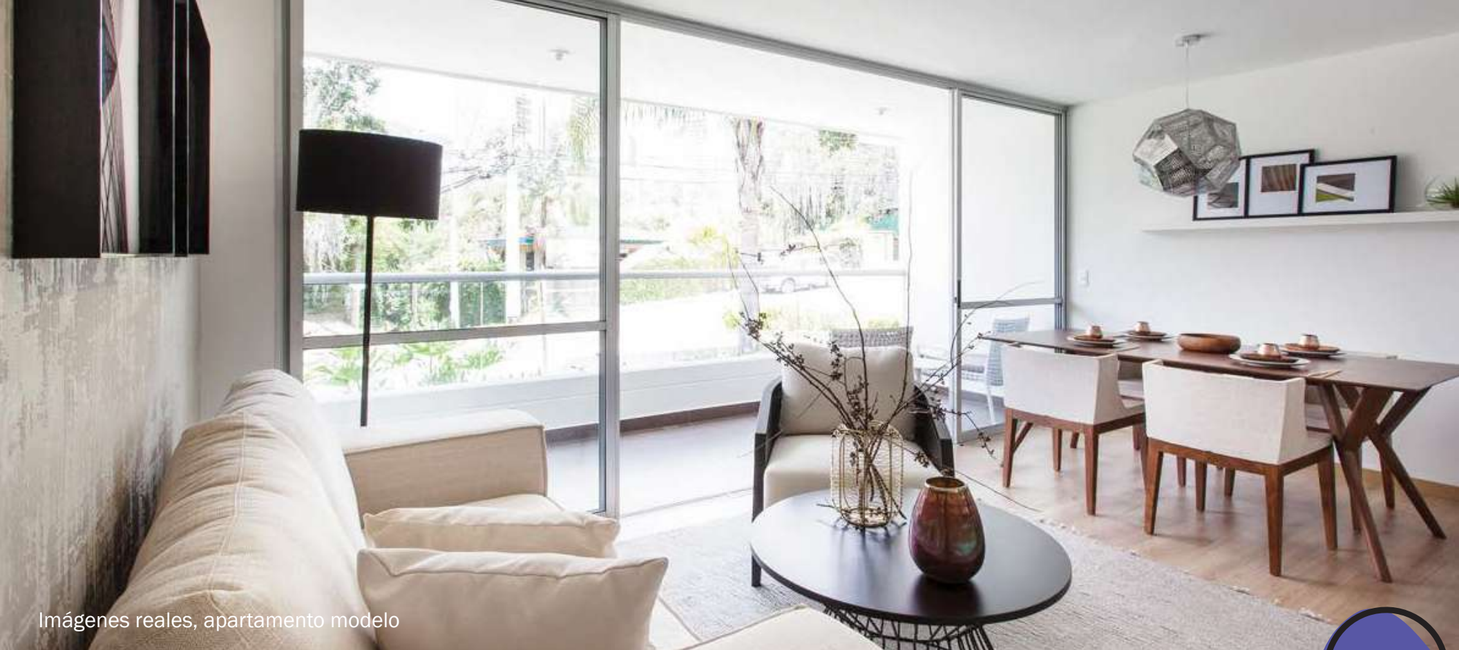
Imágenes reales, apartamento modelo