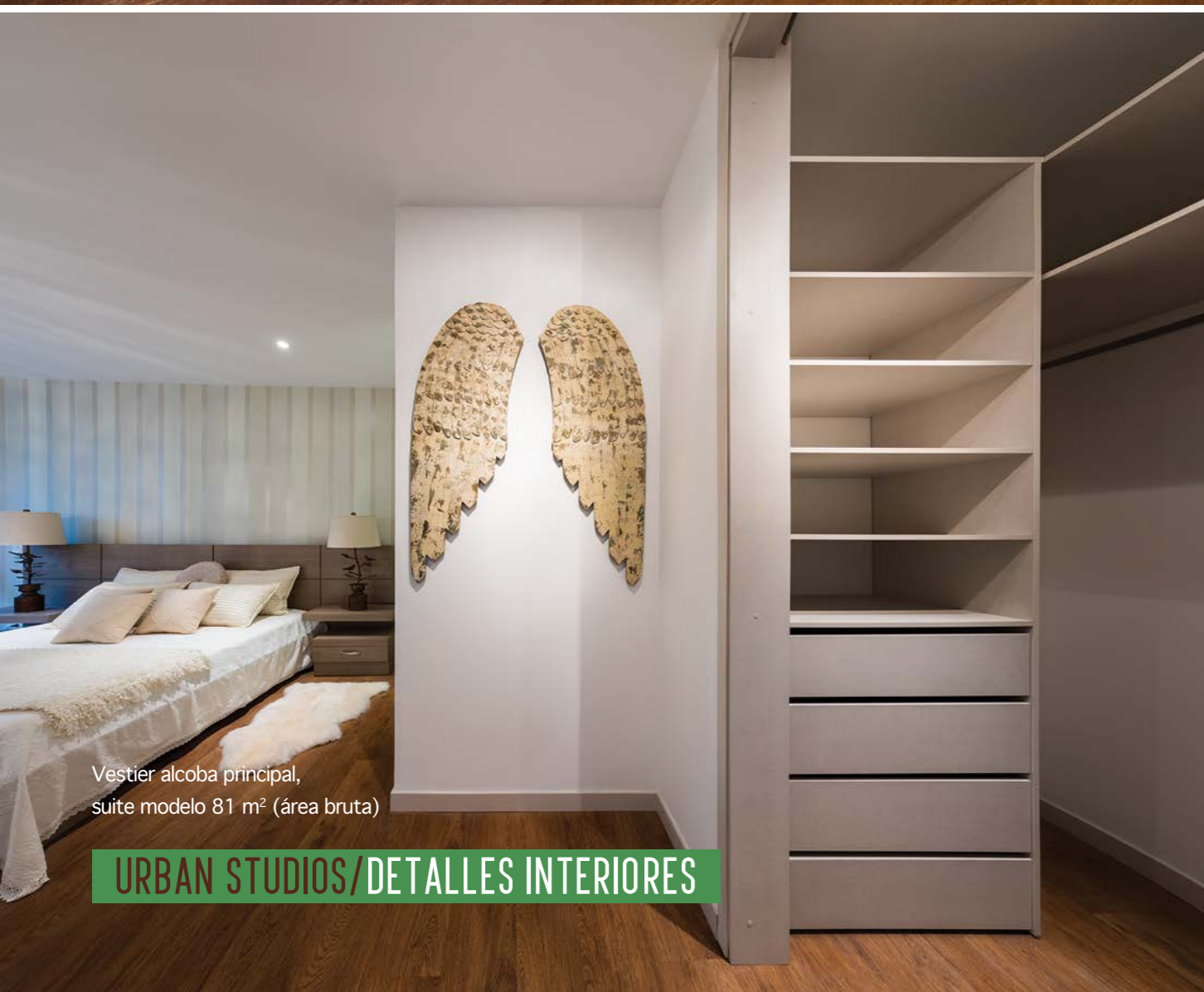
Vestier alcoba principal, suite modelo 81 m 2 (área bruta)