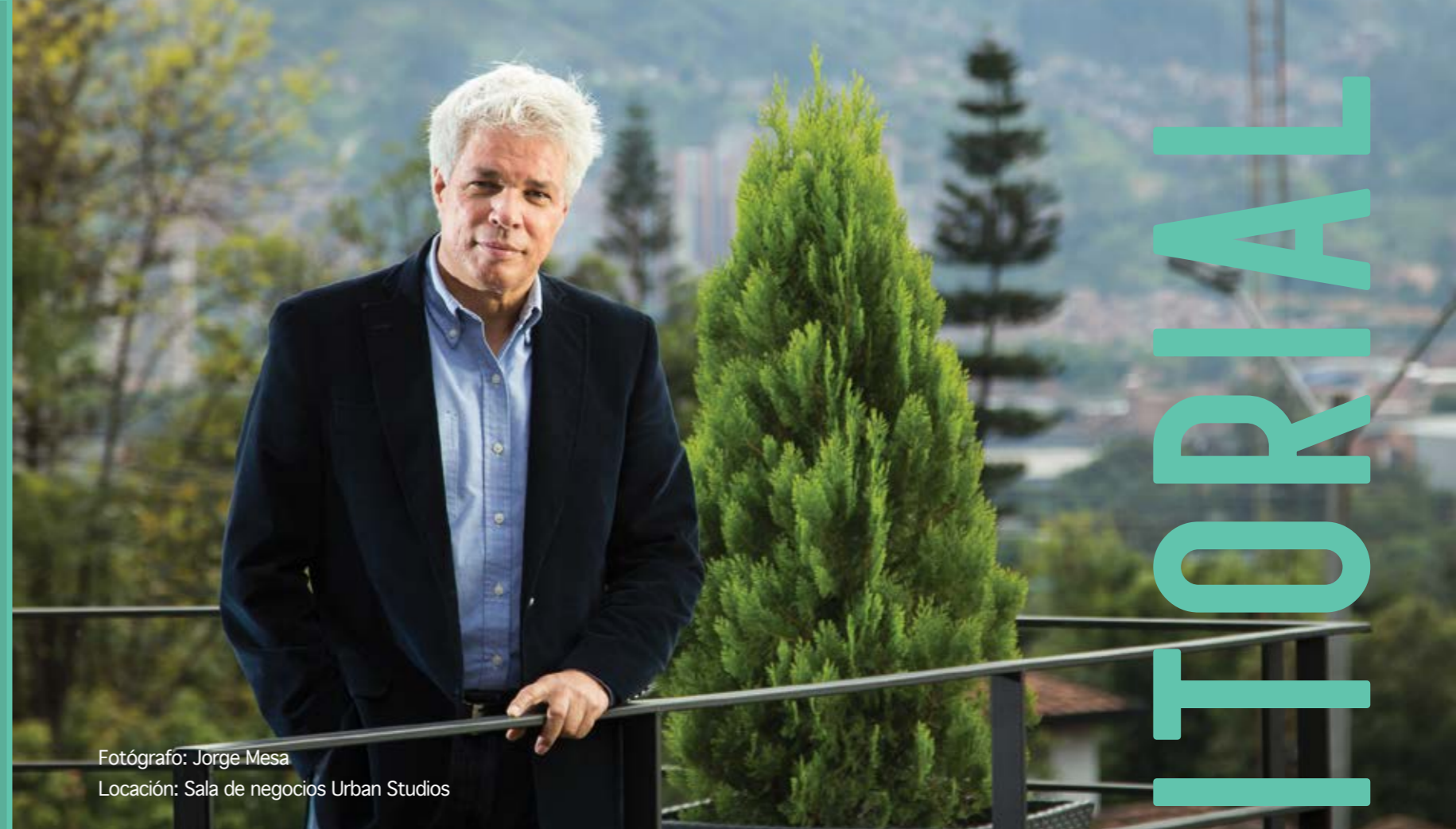
Locación: Sala de negocios Urban Studios