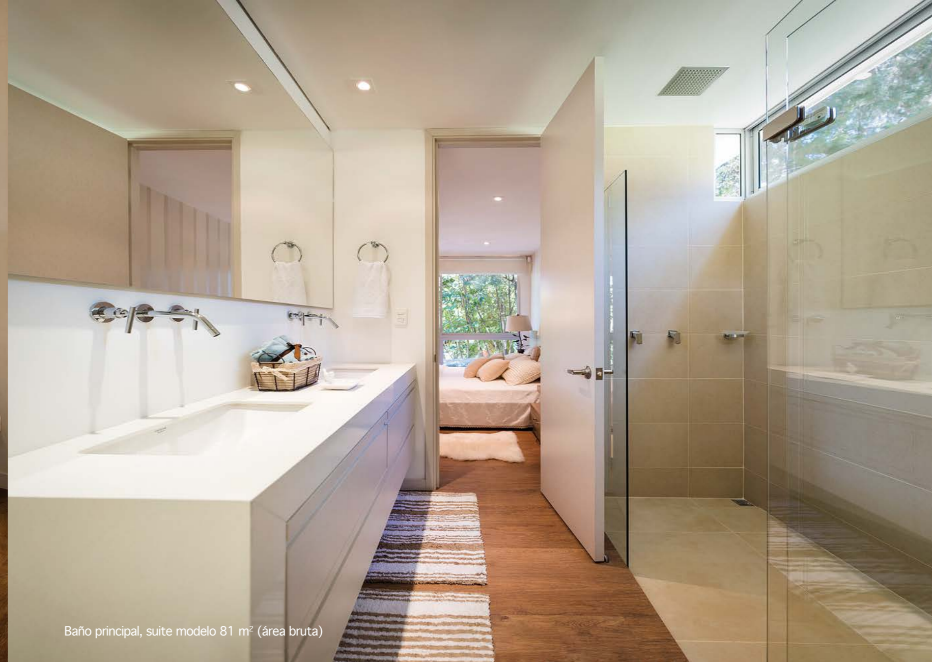
Baño principal, suite modelo 81 m 2 (área bruta)