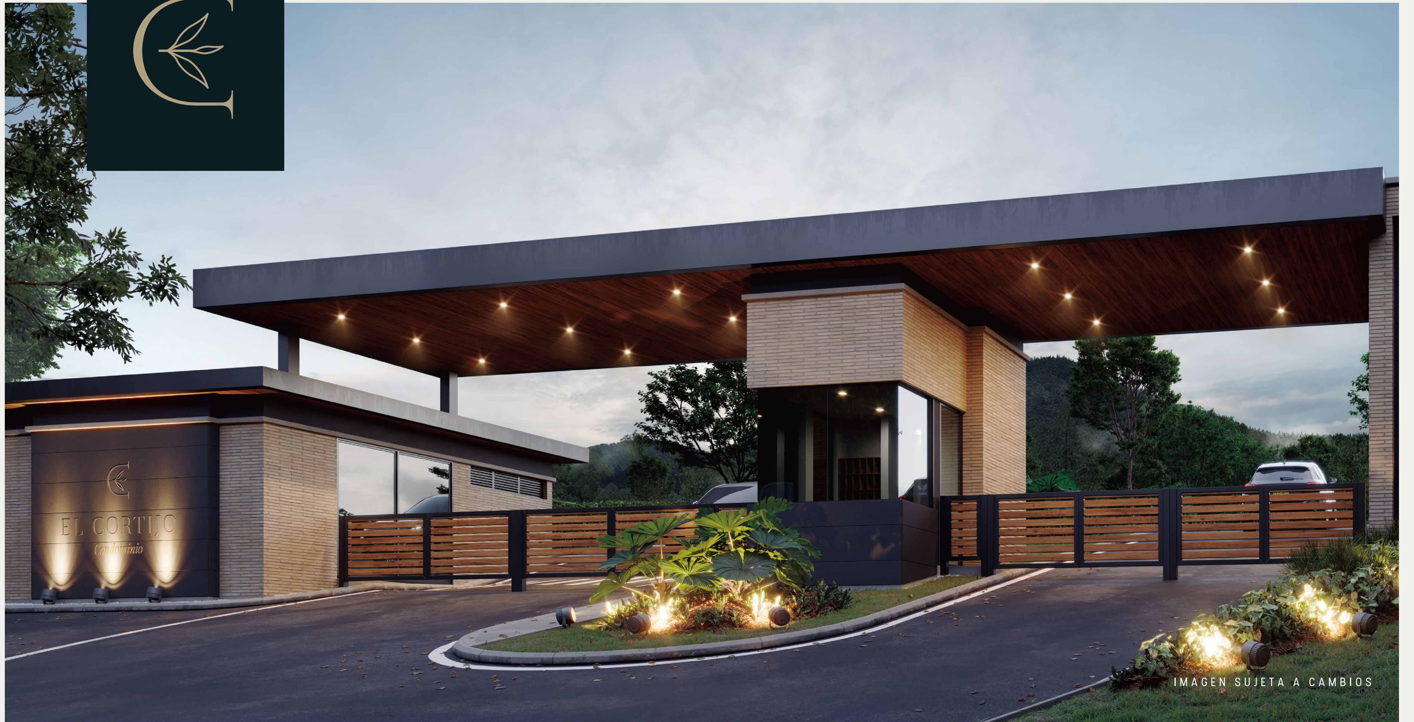
IMAGEN SUJETA A CAMBIOS