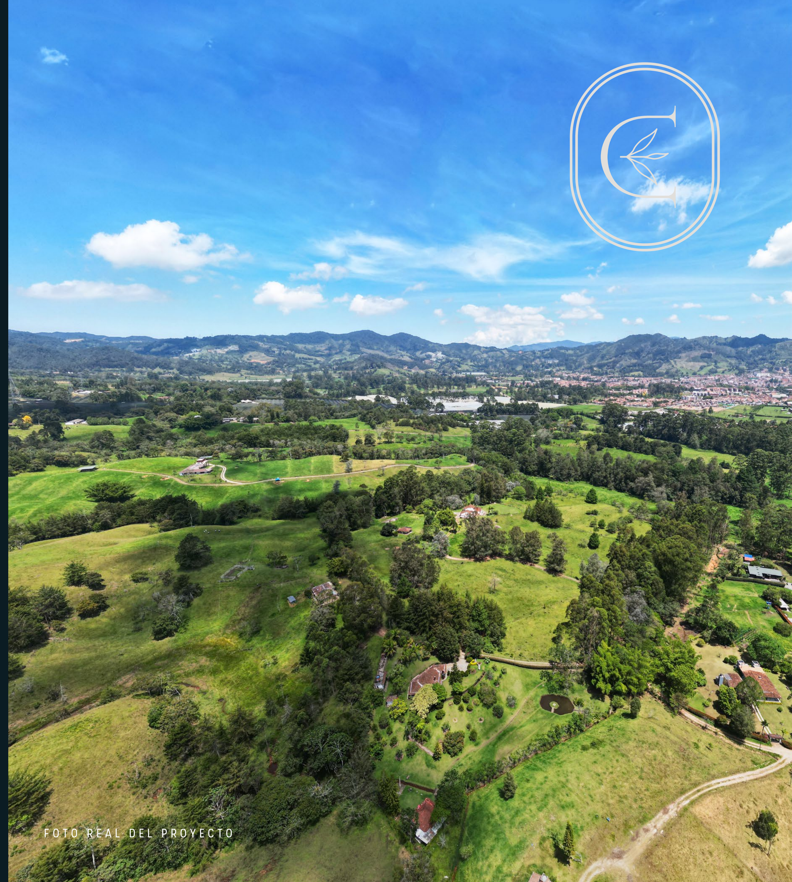
FOTO REAL DEL PROYECTO