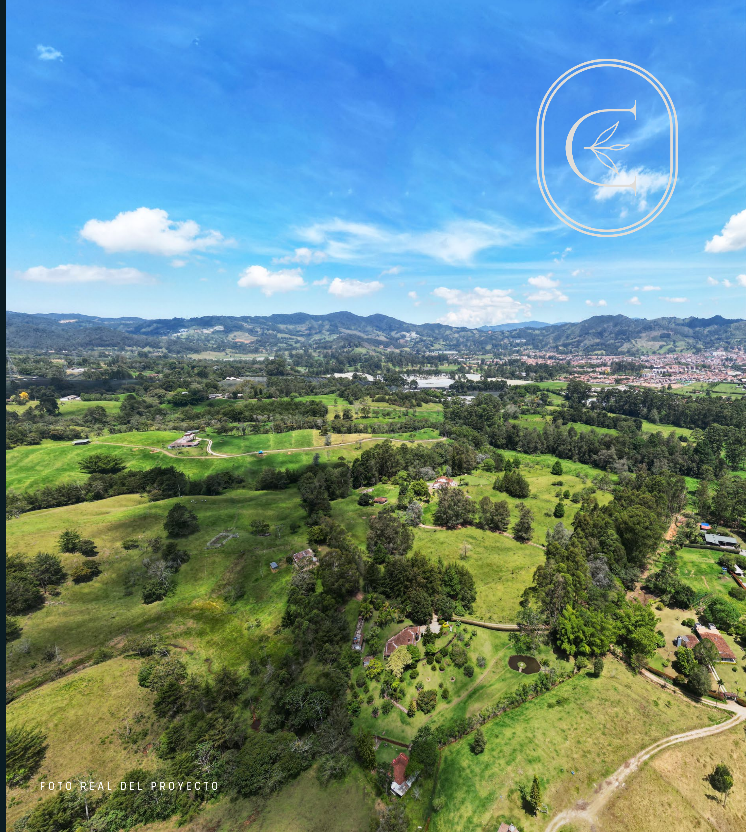
FOTO REAL DEL PROYECTO