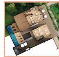
Squash, Salón social, Guardería, Gimnasio