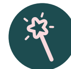
Parque de hadas