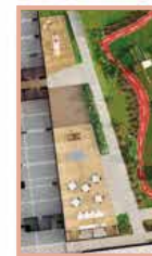
Salón adultos, Terraza, Salón social