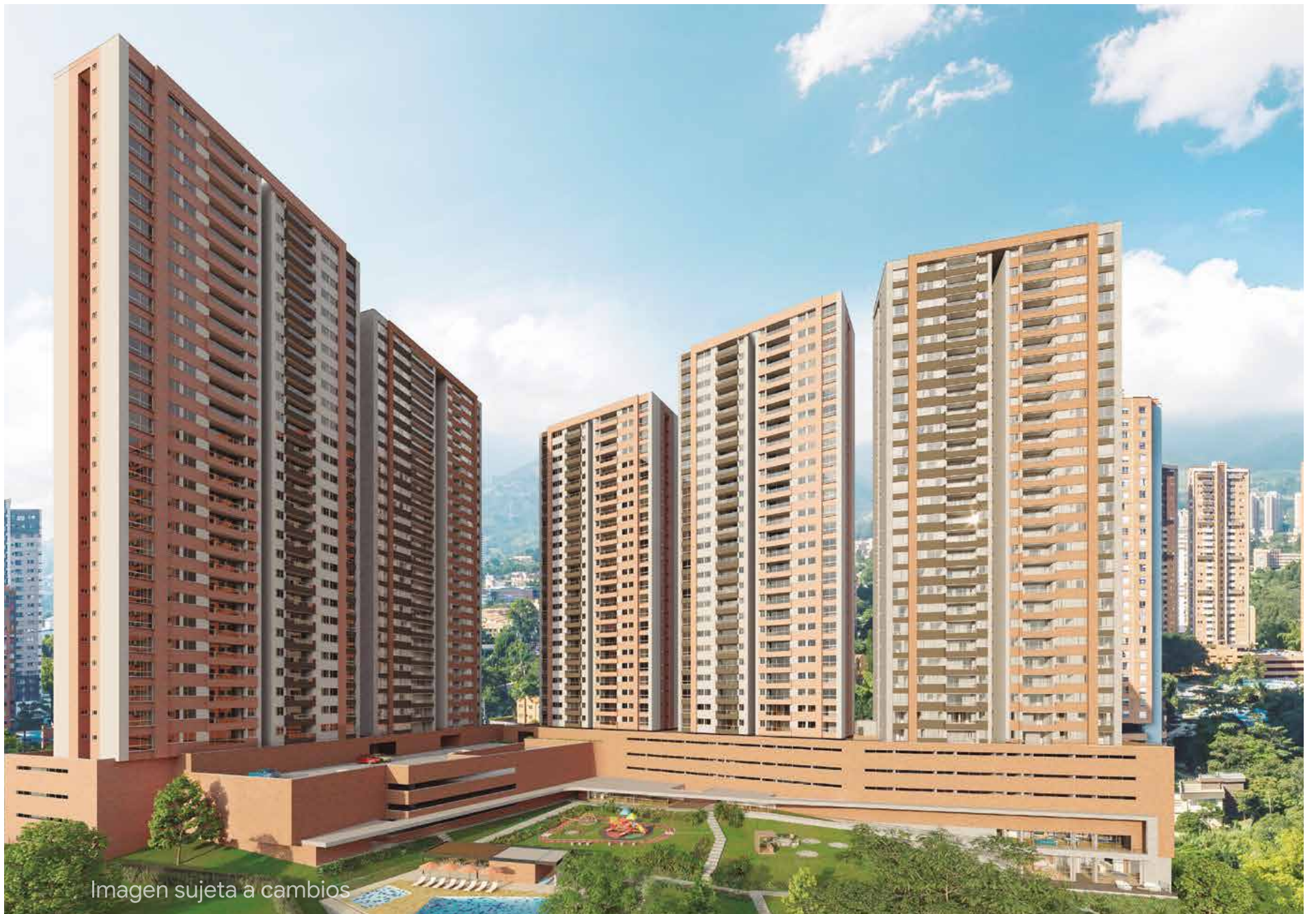
Imagen sujeta a cambios