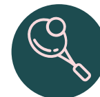
Cancha de squash