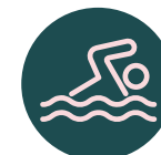
Piscina adultos y niños