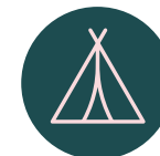
Zona de picnic